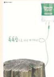
토니모리 - 강예솔