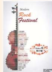
모던 락 페스티벌 - 김경두