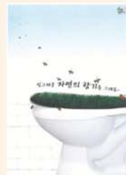
Air Wick - 김성미