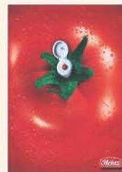
Heinz - 노희정