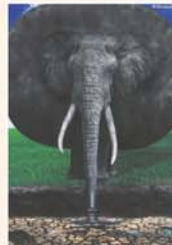
일레트로록스 - 전은지