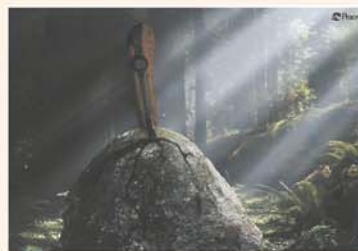
Peace - 박현경